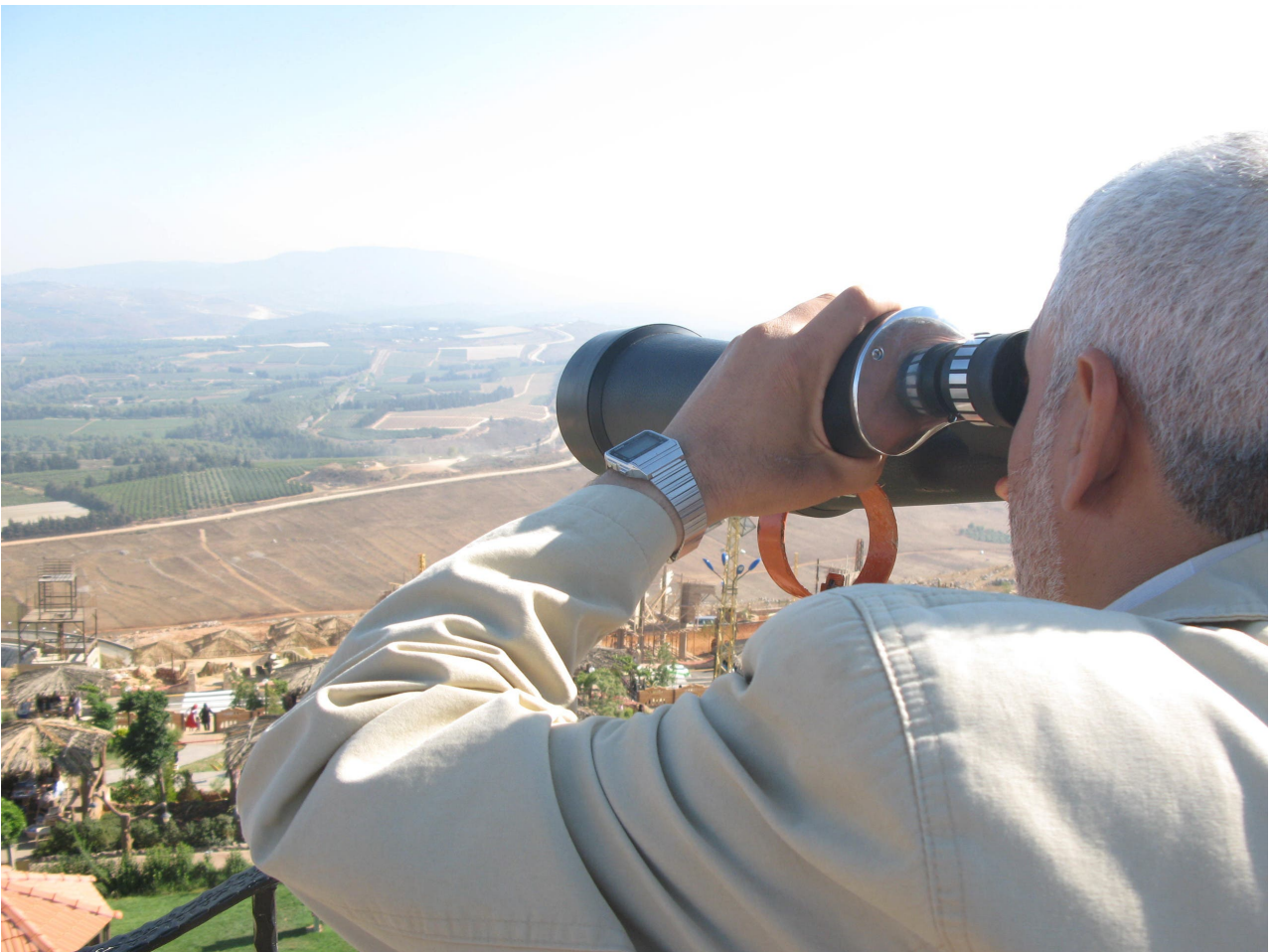
شاطري على الجبهات في سوريا