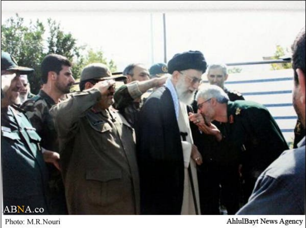
الجنرال شاطري يقبل يد خامنئي

وكانت طهران قد أرسلته بصفة رئيس "هيئة الأعمار الإيرانية في لبنان" باسمه الحركي "حسام خوش نويس" وكانت مهمته الحقيقية هي إدارة الملف اللبناني وأشيعت أنباء بأنه كان من بين المتورطين في اغتيال الحريري.