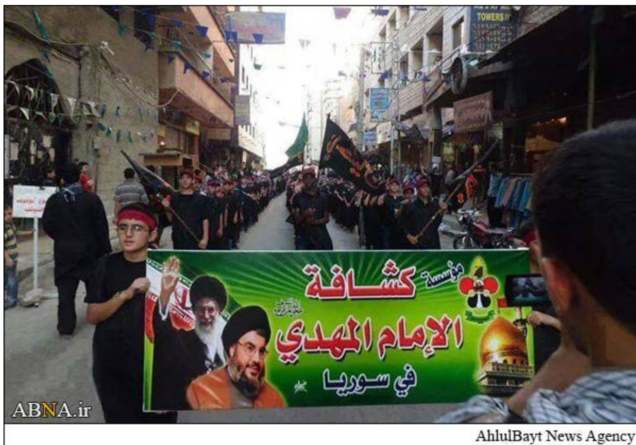
كشفة المهدي في منطقة السيدة زينب بريف دمشق