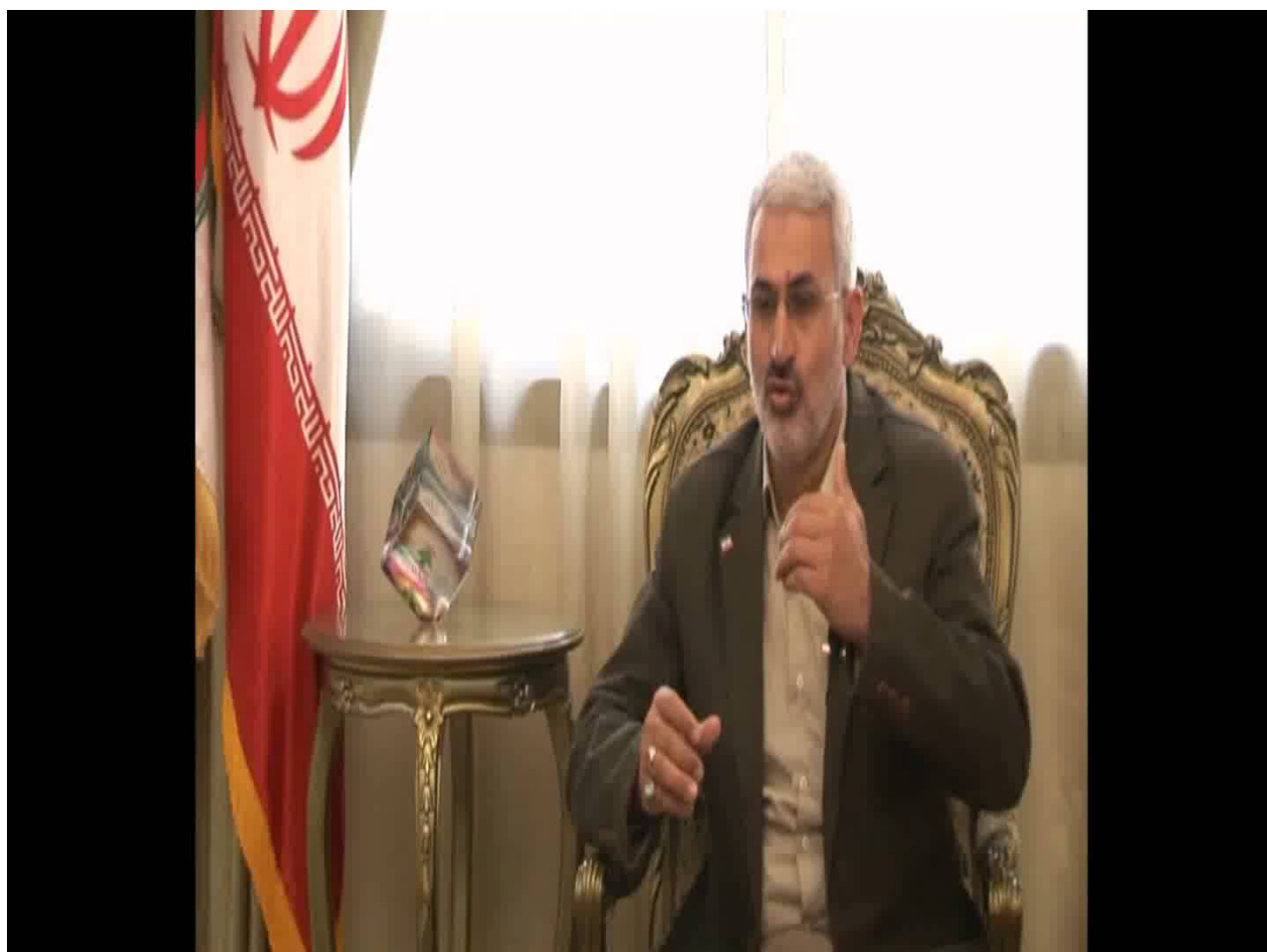
الجنرال حسن شاطري