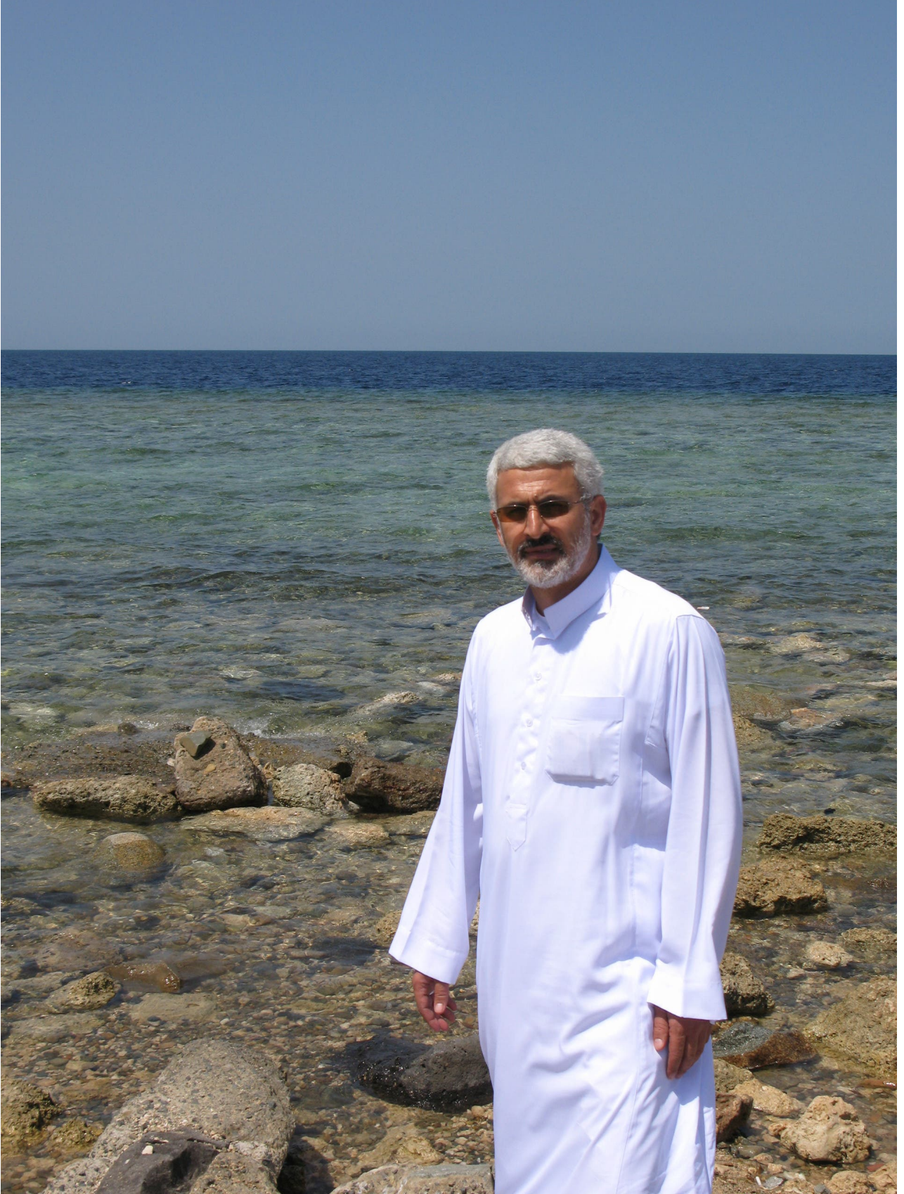
الجنرال حسن شاطري الملقب حسام خوش نويس على الساحل السوري