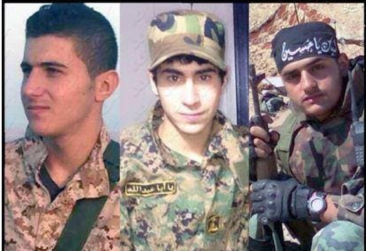
ثلاثة من كشافة المهدي التابعة لميليشات حزب الله اللبناني قتلوا في سوريا