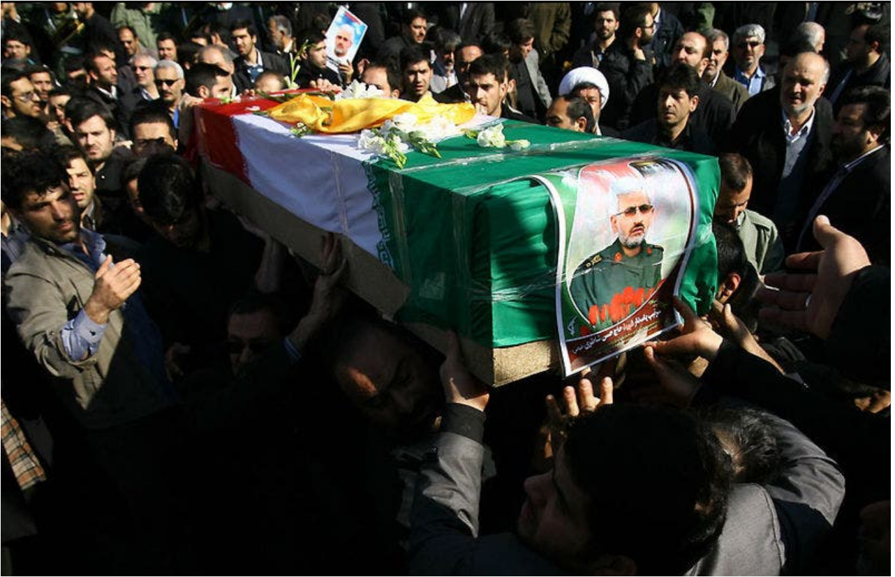
تشيع الجنرال حسن شاطري في طهران