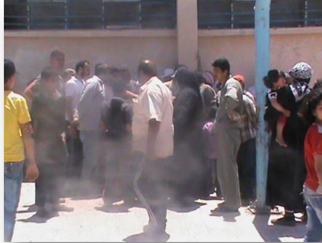
توزيع المساعدات في المزيريب

قامت هيئة فلسطين الخيرية بتوزيع مساعدات غذائية على 75 عائلة فلسطينية مهجرة من دمشق وريفها إلى بلدة مزيريب جنوب درعا التي يقطنها نحو 8500 لاجئاً فلسطينياً، يأتي ذلك في إطار محاولتها التخفيف من معاناتهم الاقتصادية والإنسانية.